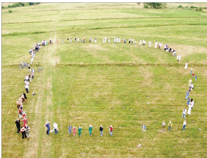
B. Uczestnicy festynu „Sobota na grodzisku” utworzyli w 2005 roku krąg w miejscu, gdzie znajdował się główny gród Księstwa Sławieńskiego, budując metaforyczną więź z przeszłością.