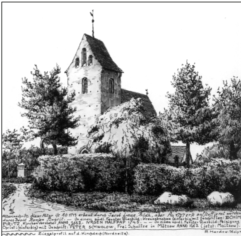
Ryc. 2. Rudolf Hardow, Kościół w Starym Krakowie, 1921, rysunek tuszem, 29,9 × 29,4

Kolejne lata i wieki przyniosły zakładanie wsi na prawie niemieckim (wiele z nich zachowało swój pierwotny placowy/owalnicowy plan) czy budowę wiejskich kościołów (ryc. 2, 3), z których niektóre są dziś perłami wiejskiej architektury gotyckiej (np. kościół p.w. św. Piotra i Pawła Apostołów w Sławsku – zob. Rączkowski 1996). Kolejne jeszcze dziś widoczne zmiany to osadnictwo XIX-wieczne (Radosław – Krause 2006), a nawet z początków XX wieku (Brzeście).