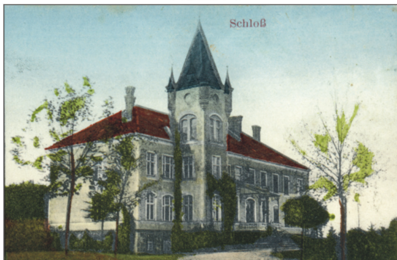
A. Pałac w Noskowie na widokówce z 1916 roku