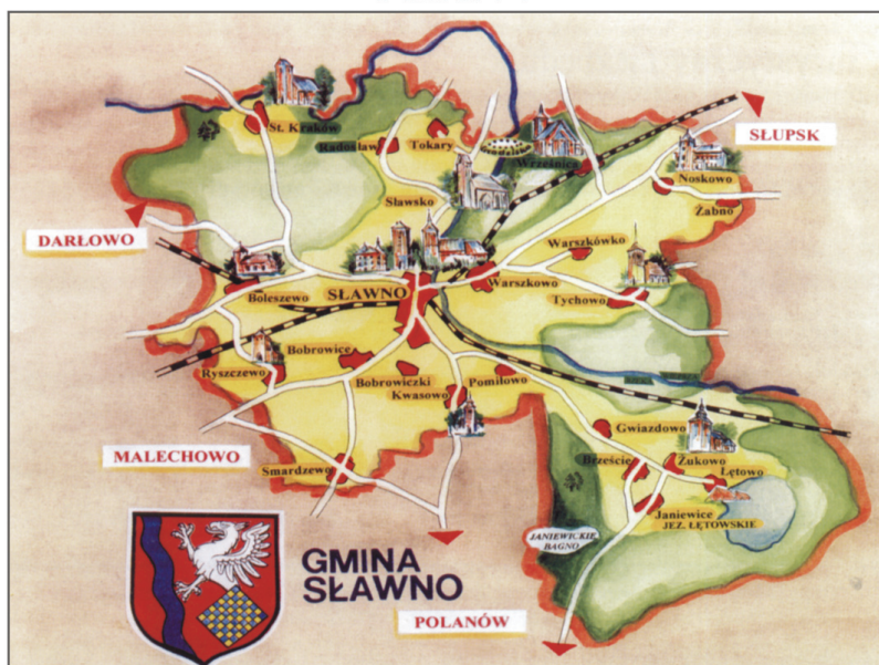
A. Schematyczna mapa gminy Sławno. Oprac. K. Kontowski