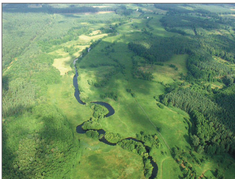
B. Krajobraz doliny Wieprzy w okolicy Gwiazdówka.